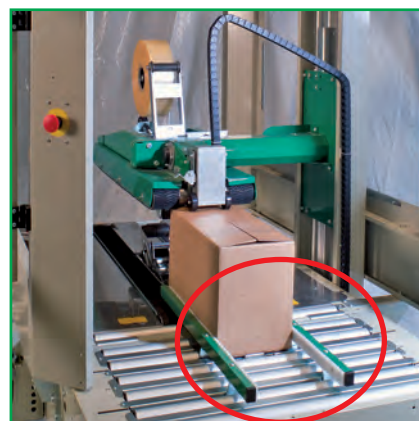
Packtisch mit pneumatischem Pakethalter.

NORMPACK Rationelle Endverpackungssysteme